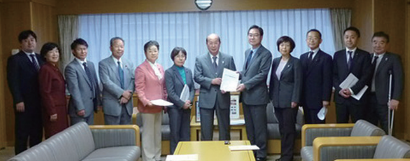
予算要望書を区長に提出する党区議団（2014年10月31日）

党区議団は、3800通を超えた全区民対象の区民アンケート返信、区内団体との懇談、実態調査で寄せられた多くの区民の声を踏まえ、予算要望を検討しました。