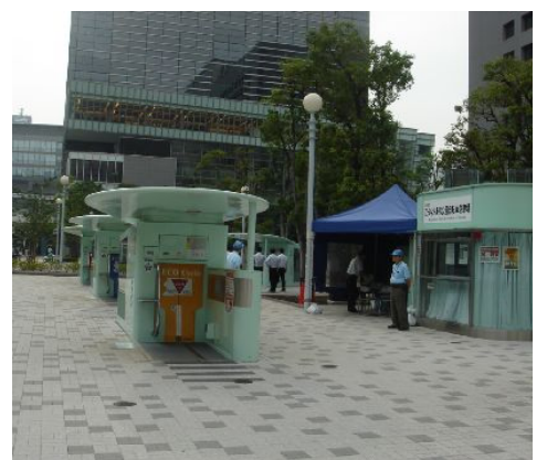
こうなん星公園自転車駐輪場

の公園自転車駐輪場」6基1224台に行きました。自転車を入ると地下収納庫へICタグで簡単に操作でき、入庫には平均で13秒(自動車は平均25秒)の速さに驚きました。大田区からも問い合わせがあったそうです。